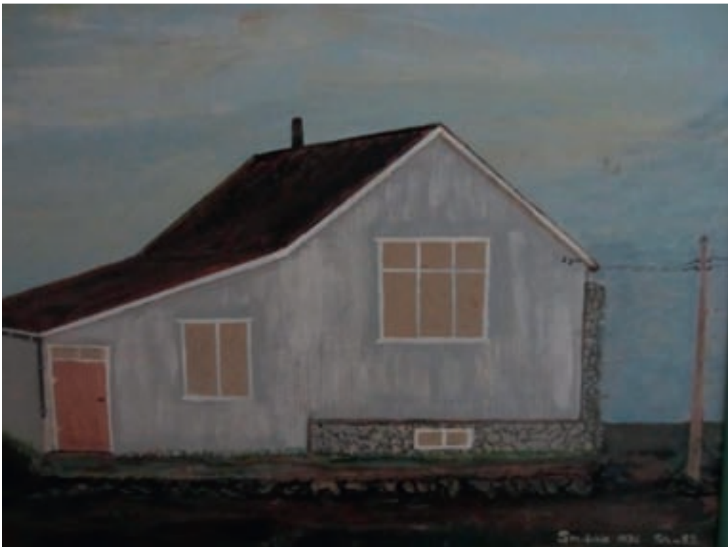
Smiðshús á Eyrarbakka 1935. Málað af Sigmundi 1982.

Sigmundur man fyrst eftir sér sem 5 ára gamall strákur þegar faðir hans leiddi hann inn í eldhúsið í Smiðshúsum sem þau voru að kaupa árið 1927. “Ég man að það var full vatnsfata á bekknum til vinstri þegar við gengum upp þessar 4 tröppur og komum í eldhúsið, sem var mjög lítið ekki meira en svona tæpir 2 sinnum 3 metrar á kant.” Í frásögn Sigmundar fylgir síðan nánari lýsing á Smiðshúsum.