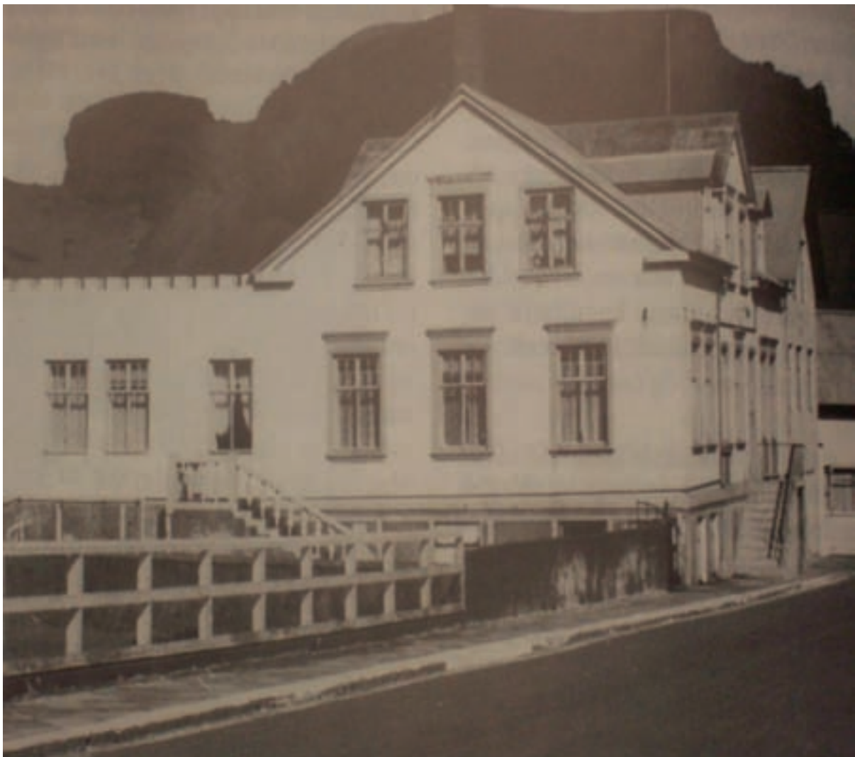
Húsið Tunga á Heimagötu 4 – Hótel Berg.