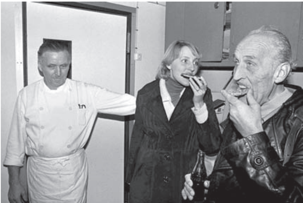
La Bakisto er monsaralegur á þessari mynd.