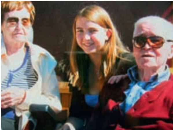
Heiðurshjónin ásamt Ástrós að njóta sólar á sólpallinum á Hraunbúðum.

Þau eru mjög sátt á Hraunbúðum og láta vel af vistinni þar. Þau eru öllum svo þakklát fyrir þá góðu þjónustu og umönnun sem þau fá þar. Þar koma berlega í ljós kostir þess að lifa í litlu samfélagi þar sem nálægðin og tíminn er meiri. Það er virkilega gaman að heimsækja þau en þar vilja þau og starfsfólkið allt fyrir mann gera. Ágætis dæmi um það er þegar höfundur kom í óvænta heimsókn þegar móðir hans lá á sjúkrahúsinu. Þá var honum boðið að gista hjá föður sínum í herberginu á Hraunbúðum og svaf hann í rúmi móður sinnar. Það voru sáttir feðgar sem fóru í rúmið það kvöldið og vildi sá eldri endilega gefa þeim yngri brjóstsykur með bókalestrinum fyrir svefninn því það gerði hann venjulega. Sá eldri var með varann á sér alla nóttina þar sem hann var stöðugt að spyrja þann yngri hvort hann svæfi ekki vel sem og hann gerði þar til hann var vakinn næst til að spyrja hvort hann væri sofandi. Það skipti nú engu máli því hann gat alltaf sofnað strax aftur. Þetta var eftirminnileg heimsókn og vill höfundur nota tækifærið til að þakka starfsfólki Hraunbúða fyrir allt það sem þau hafa gert fyrir foreldra hans. Þar er mjög manneskjuleg og elskuleg umönnun og vistfólki er sinnt af virðingu og alúð – Það er virðingarvert og ber að þakka.