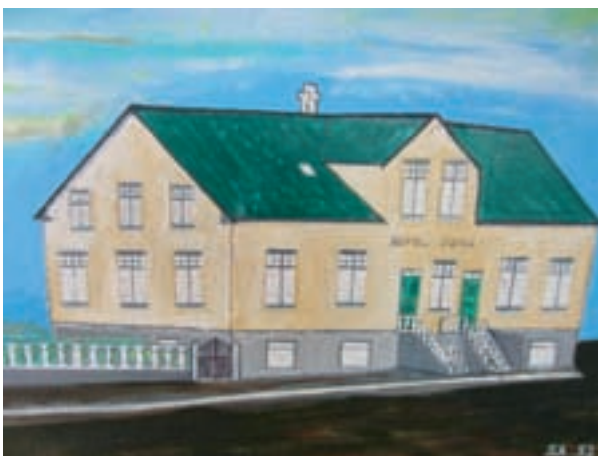
Hótel Berg. Málað af Sigmundi 1982.