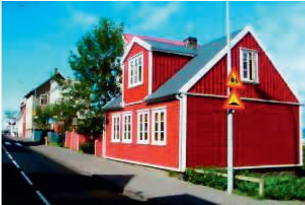
Vesturgata 44, Reykjavík.