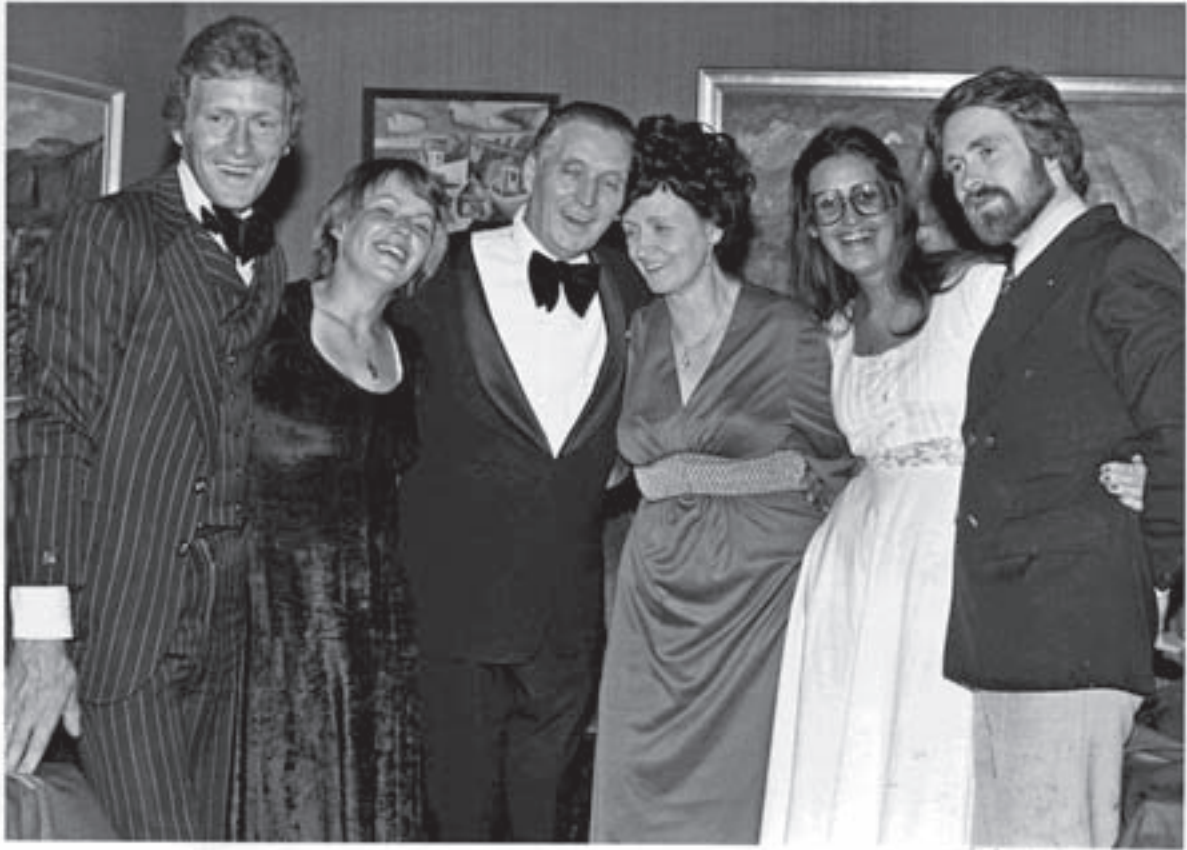
Ánægð bakarahjón á landsþingi bakameistara í Vestmannaeyjum árið 1976.