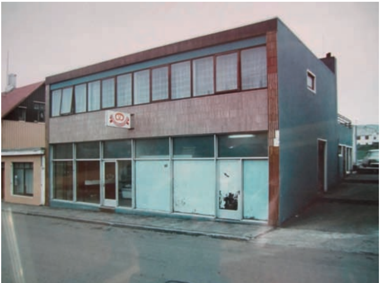
Vestmannabraut 37 – Magnúsarbakarí.