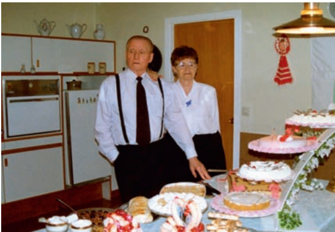
Heiðurshjónin við hlaðið veisluborð á Vestmannabrautinni.