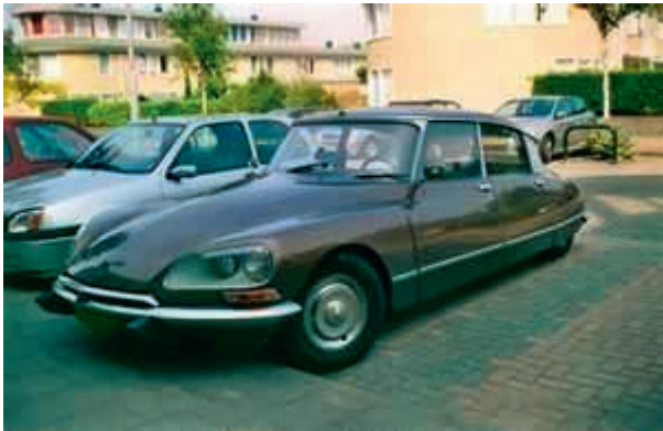
Citroen DS - Sigmundur var Citroén aðdáandi og fannst gaman að keyra mjúkan DS sem hægt var að hækka og lækka eftir aðstæðum.