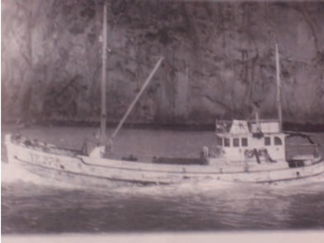
m/b Kap VE 272